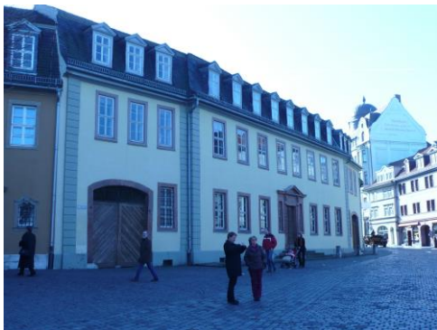
Goethehaus in Weimar